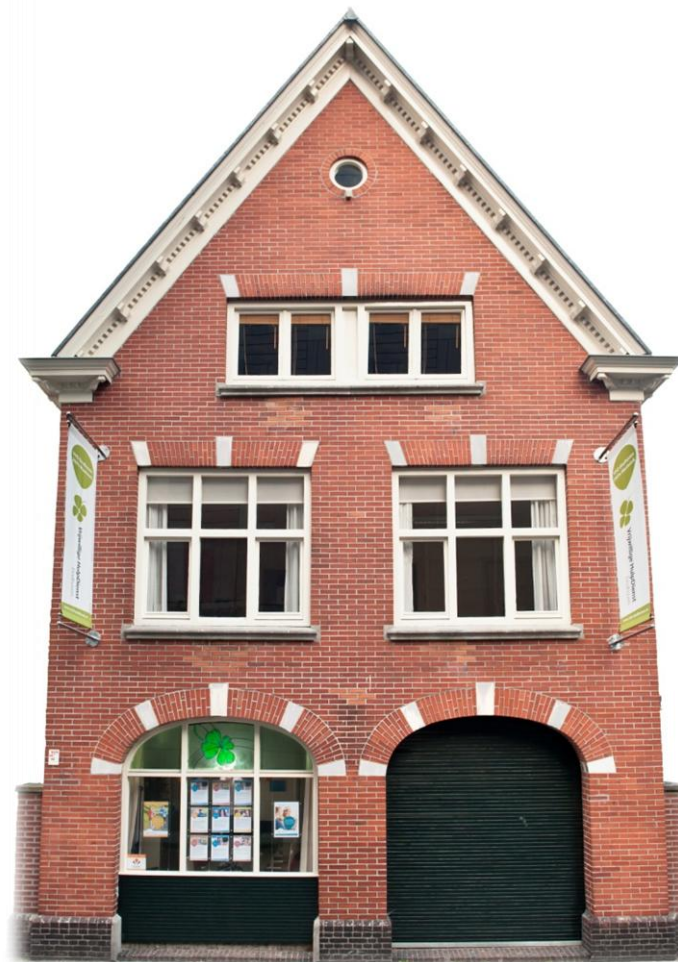
Pand van de VHD in de Raiffeisenstraat